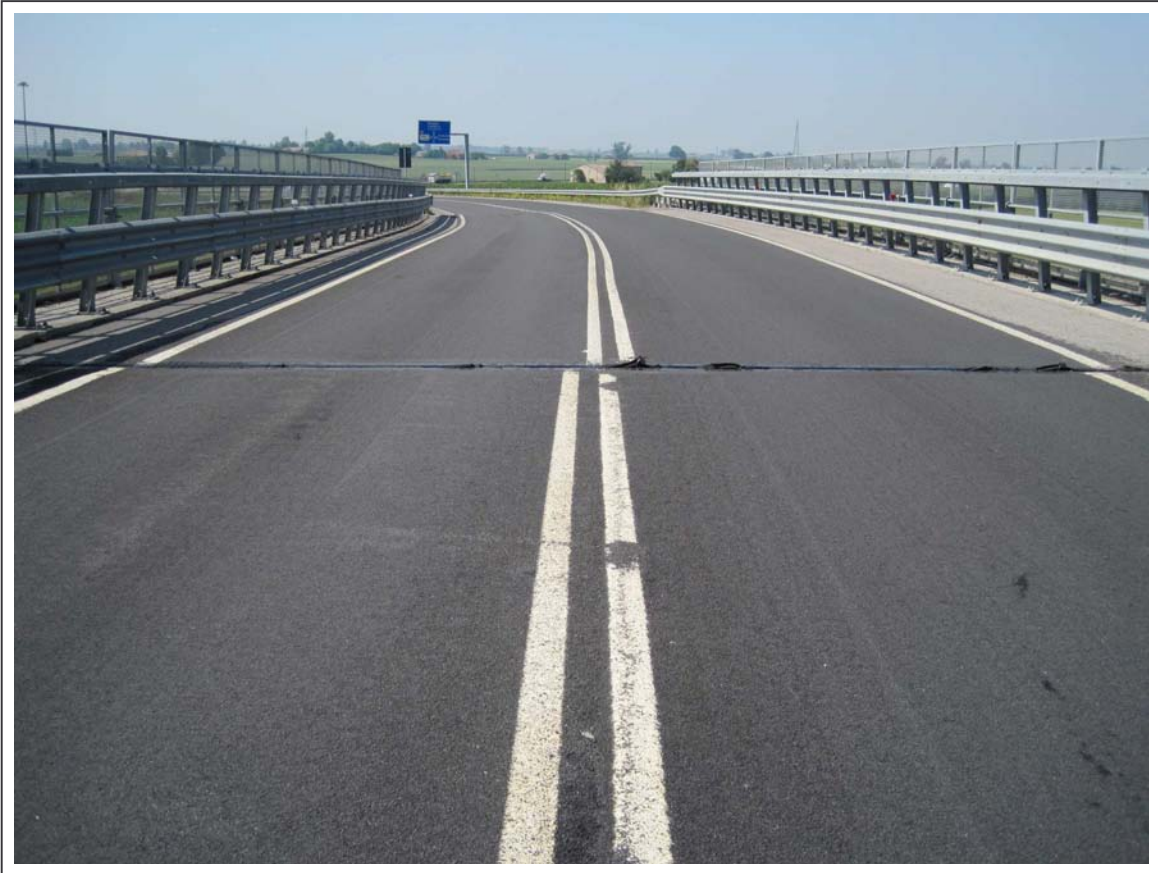
23-05-2012 carreggiata sopra PILA 11